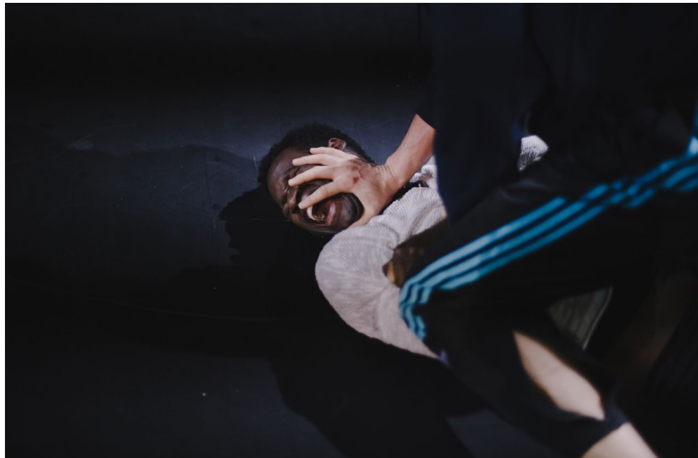
Répétitions à Les Gémeaux, Scène Nationale de Sceaux, 2026.