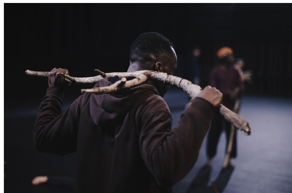
Répétitions à Les Gémeaux, Scène Nationale de Sceaux, 2026.